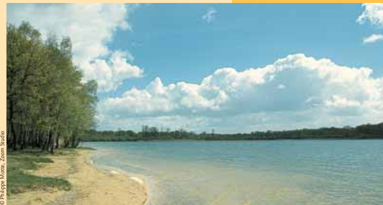
L'étang du Puits.

ATTENTION berges du canal instables ; baignade généralement interdite.