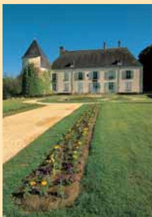
Le château d'Argent-sur-Sauldre.