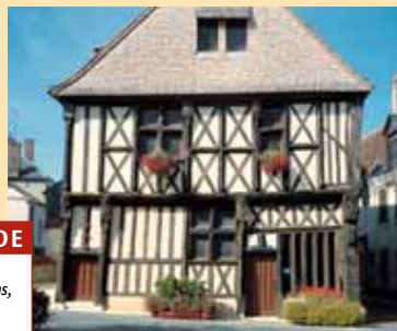
Maison en pan de bois dite « de François I er » appartenant à l'ensemble exceptionnel de maisons à colombages d'Aubigny-sur-Nère.