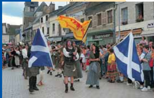
En juillet, Aubigny fête l'Auld-Alliance, la « Vieille Alliance » entre Français et Écossais, qui remonterait à l'époque de Charlemagne.

Et lorsque, l'été venu, elle se pare pour commémorer ses origines franco-écossaises, drapeaux, kilts et cornemuses envahissent les rues.