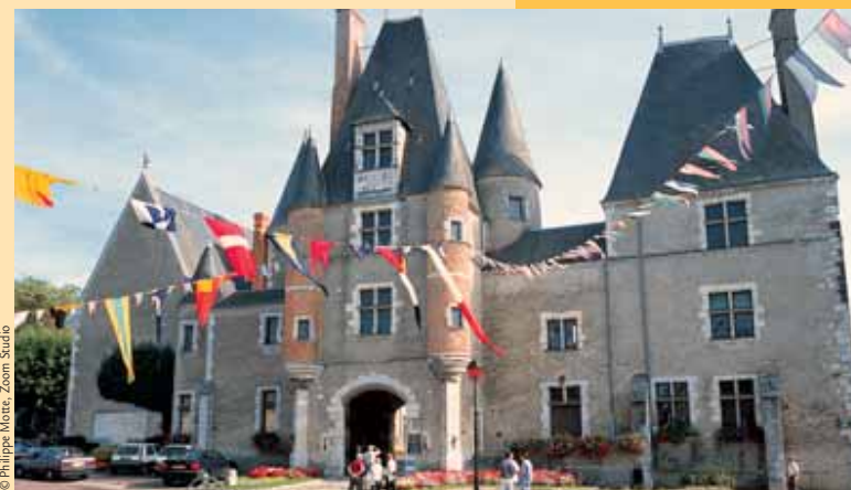
Le château des Stuarts au cœur de la vieille ville.

ATTENTION prudence en période de chasse et à proximité de l'aérodrome.