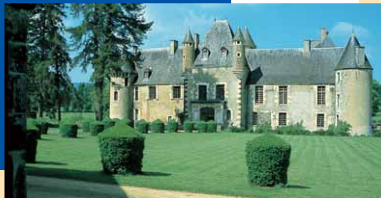
Philippe Marce, Zoom Studio

Le château Boucard, une étape de prestige sur la route Jacques-Cœur.