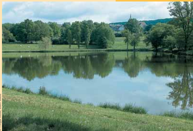
Le vaste plan d'eau en contrebas de Jars.