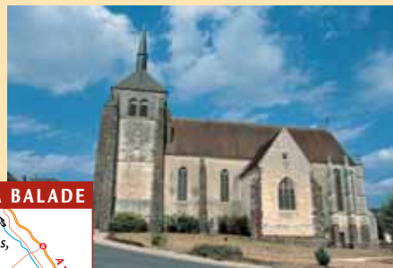
L'église Saint-Aignan à Jars.