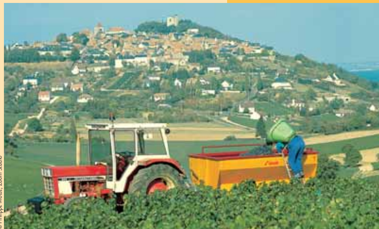
Vendanges en Sancerrois.

ATTENTION prudence sur les portions routières.