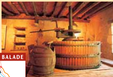
Musée du Vigneron de Verdigny.