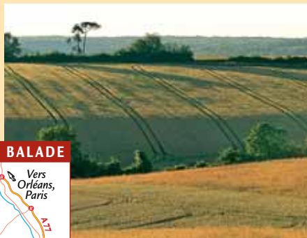
Paysage vers Morogues.