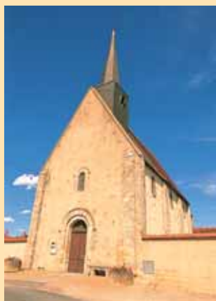
L'église Saint-Martin de Méreau, XI e siècle.