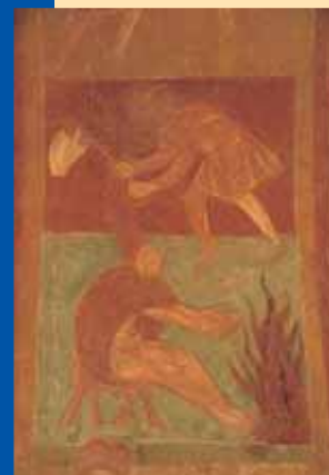
Occupation de la période hivernale, fresque des travaux des mois.

Sur l'arc reliant la nef et le chœur, les travaux des mois sont illustrés en douze scènes très évocatrices.