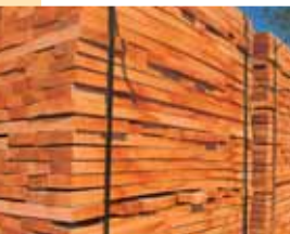
Des merrains de chêne destinés à la fabrication de douelles de tonnellerie.

1 La suivre très brièvement à gauche, s'engager sur un chemin à droite, puis tout droit. Couper un chemin, puis un deuxième et poursuivre tout droit en délaissant deux chemins à gauche. Au troisième, tourner à gauche, puis à droite jusqu'à une route.