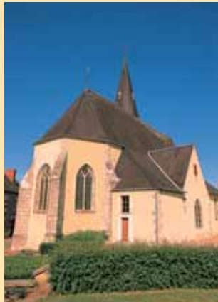
L'église Saint-Firmin de Méry-ès-Bois.