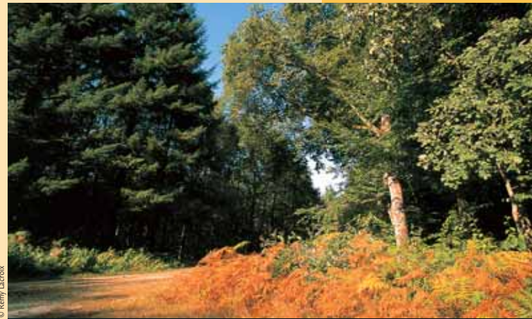
Chemin forestier à Méry-ès-Bois.