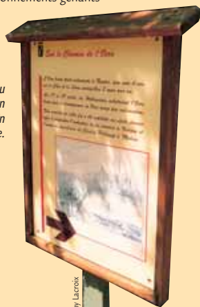
Panneau d'information sur le Chemin de l'ocre.