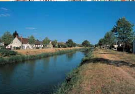
Le canal de Berry, réalisé au début du XIX e siècle pour favoriser l'essor économique du bassin de Vierzon.

ACCÈS AU DÉPART : à Vierzon, longer le canal de Berry au centre-ville vers l'aval, puis suivre la direction de la station d'épuration des vallées, et/ou vers l'A 20 jusqu'à couper le canal de Berry, rue Émile-Zola.