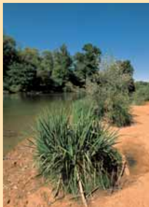
Rive sauvage du Cher près de Méry.