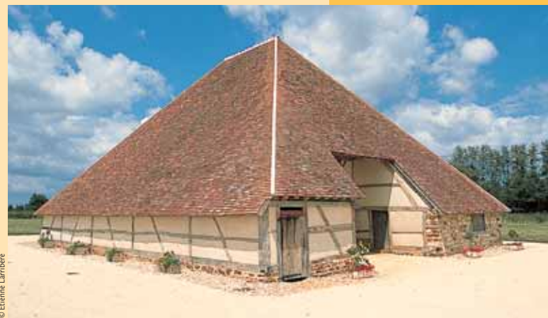
La grange pyramidale de Vailly-sur-Sauldre.

ATTENTION prudence sur les portions routières.