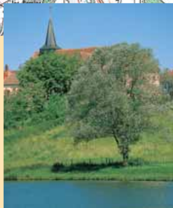
Santranges côté jardin.