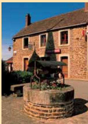
Le bourg de Santranges.