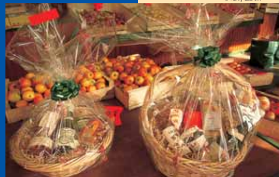
Ici, tout se dit avec des pommes !

Alors que les vergers d'autrefois étaient composés de pommiers, pruniers, poiriers, noyers et châtaigniers, l'arboriculture actuelle est presque exclusivement spécialisée dans la production des pommes, toutes variétés confondues. Grâce au perfectionnement des techniques d'irrigation – désormais assurée par un système de goutte-à-goutte – et l'emploi de filets paragrêle, la qualité et la quantité de fruits produits se sont très sensiblement améliorées. Plus de 60 % de la production est exportée vers les autres pays d'Europe. La vigne, bien entendu, est aussi à l'honneur sur le territoire des trois communes traversées, cette zone faisant partie de l'aire d'appellation contrôlée de Menetou-Salon.