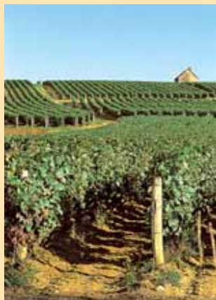
Vignoble de Menetou- Salon.