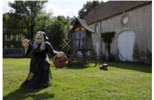
Musée de la sorcellerie

Voilà 20 ans que le Musée de la Sorcellerie, à Conressault dans le Cher, fait frissonner petits et grands de ses contes et légendes de sorciers. A cette occasion, on pourra découvrir ou re-découvrir 20 saisons d'expositions. L'exposition annuelle sera en effet une rétrospective des expositions présentées jusque-là sur l'histoire des sorciers et "j'teux d'sorts", des monstres féeriques et autres personnages fantasmagoriques et des fameux procès en sorcellerie célèbres du XVI ème siècle. www.musee-sorcellerie.fr