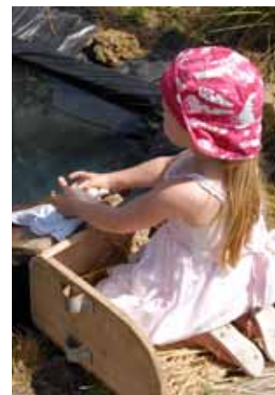
Maison des Traditions

La Maison des Traditions de Chassignoles fait la part belle aux enfants «petits ou grands» en proposant tout en s'amusant de découvrir le travail et le quotidien des paysans du siècle dernier. Les enfants pourront fabriquer des jouets à partir d'éléments trouvés dans la nature comme le faisaient leurs aïeux au temps où la télé, l'électricité et le plastique n'existaient pas ! Pendant ce temps, leurs parents pourront s'initier aux danses traditionnelles du Berry au son de la vielle et de la cornemuse des «Sonneurs de la Vallée Noire».