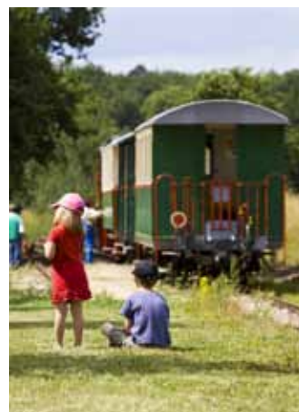
Train du Bas-Berry

A travers prairies, champs et forêts, le train touristique du Bas-Berry invite à musarder tout au long des 27 kilomètres de la voie métrique qui relie Ecueillé à Argy. Châteaux, abbayes, base de plein air ponctuent le cheminement de ce «tortillard» à vapeur animé par des bénévoles passionnés.