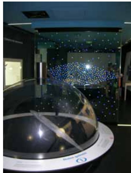
Ferme du Travail Coquin

En plein cœur de la Sologne, on découvre avec surprise au milieu des paysages de forêt, un observatoire de radioastronomie parmi les plus importants du monde avec un espace de découverte comprenant planétarium et scénographie présentant les activités du radiotélescope. A coup sûr, toute la famille ressortira les yeux remplis d'étoiles et la tête dans les nuages. www.poledesetoiles.fr