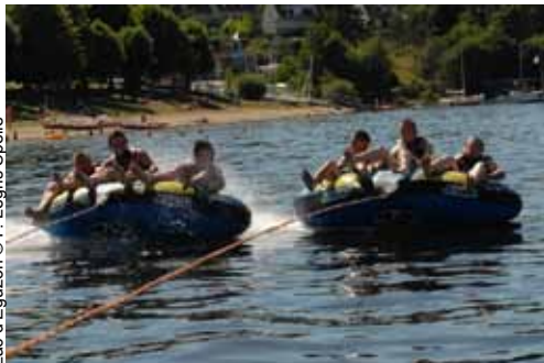
Lac d'Eguzon