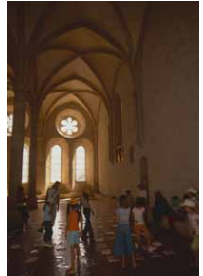
Abbaye de Noirlac

Cette animation est créée par Jamy Gourmaud (animateur de l'émission C'est pas Sorcier sur France 3).