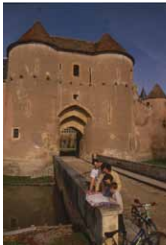
Château d'Ainay-le-Vieil

Être un chevalier ou une princesse au cœur d'un château d'exception, voilà le rêve d'enfant que réalise le château d'Ainay-le-Vieil. Sur demande, les enfants peuvent être déguisés le temps de la visite du château. Ces chevaliers et gentes dames peuvent également participer à une chasse aux énigmes sur le dragon d'Ainay.