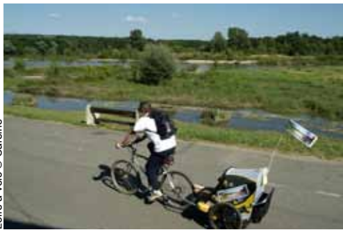
Loire à vélo

Sur l'itinéraire Loire à Vélo, la visite de la Maison de Loire permet à toute la famille de découvrir le patrimoine naturel et culturel du plus long fleuve de France. Des expositions, animations et stages photos sur la faune et la flore ligériennes sont autant de façons de s'immerger en pleine nature.