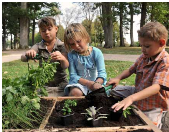
Château de Valençay, jardin d'Antonin