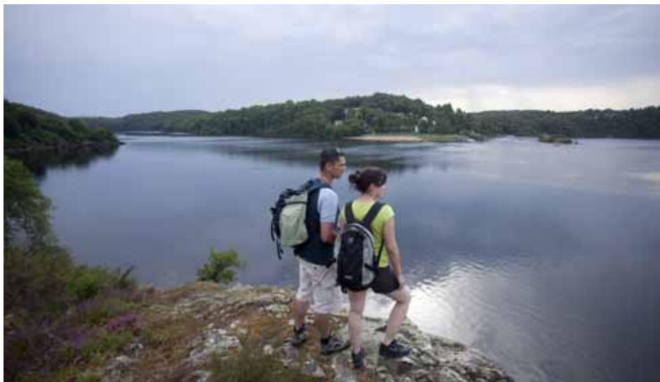
Rando en Val de Creuse