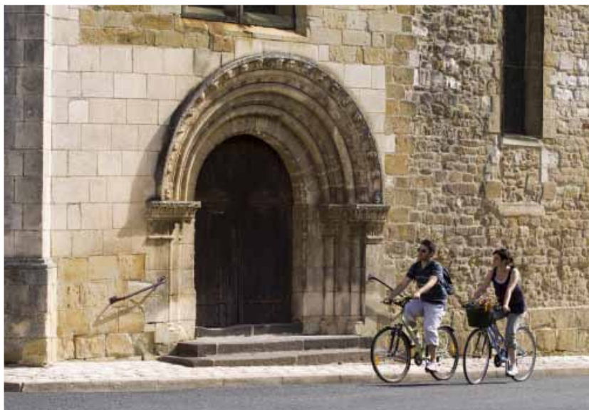
Le Saint-Jacques à vélo

Quatre voies principales - toutes inscrites au Patrimoine mondial de l'UNESCO - traversent la France parmi lesquelles la voie de Vézelay qui traverse d'est en ouest le Cher puis l'Indre. Cette voie appelée aussi « Via Lemovicensis » part de Vézelay, traverse le Berry, le Limousin, le Périgord et le sud-ouest de la France pour gagner l'Espagne. Elle a la particularité de se scinder dès le départ de Vézelay : il y a donc ce que l'on appelle communément « la voie Nord » qui passe par Bourges et Châteauroux, et la « voie sud » qui traverse Saint-Amand-Montrond et La Châtre. C'est à Gargilles,