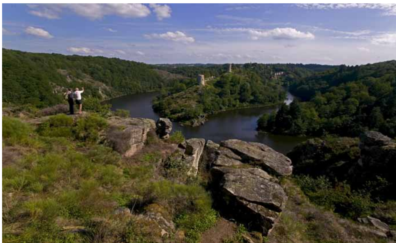
Vue sur les ruines de Crozant

Un week-end de randonnée sur les traces des peintres impressionnistes. A Gargillesse, visite de la Villa Algira, maison de campagne de George Sand, puis visite des ruines de Crozant que l'on voit depuis le rocher de la Fileuse. 2 nuits en demi-pension, en chambre à la ferme et paniers pique-nique.