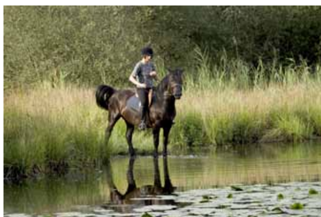
Rando à cheval en Brenne