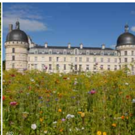
Château de Valençay