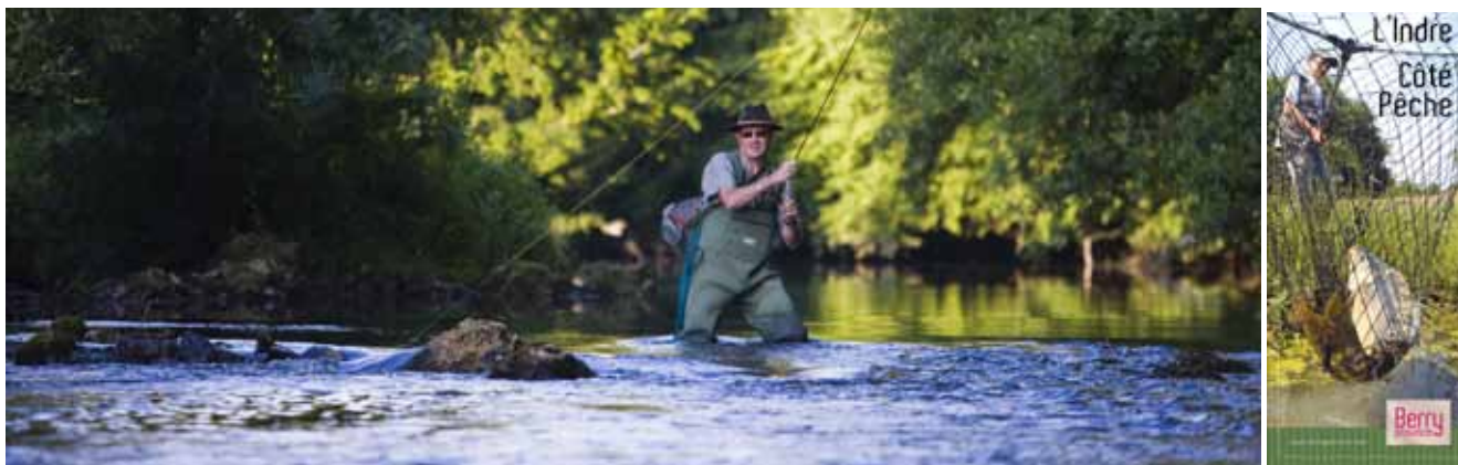
Pêche en rivière