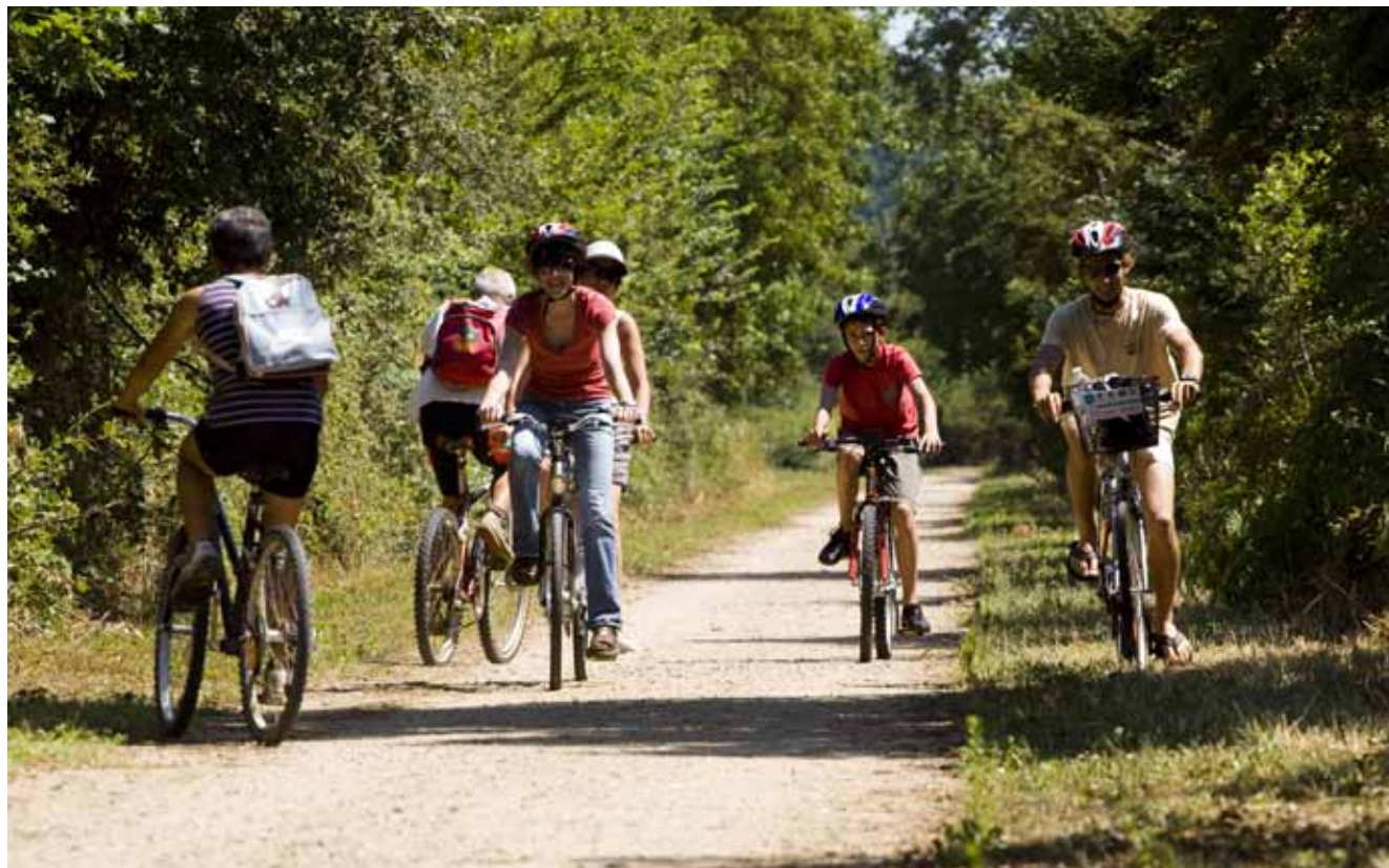
Randonnée à vélo

Des bocages et prairies du Pays de George Sand aux étangs de Brenne bordés de landes, des rives encaissées de la Vallée de la Creuse aux verts pâturages du Pays de Valençay, le tourisme de nature est partout dans l'Indre, favorisé par la diversité des paysages et la multitude d'activités accessibles à tous.