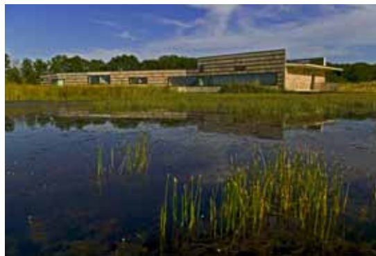
Maison de la nature et de la réserve de Chérine