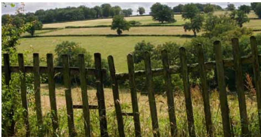
Bocages du Boiscaut Sud