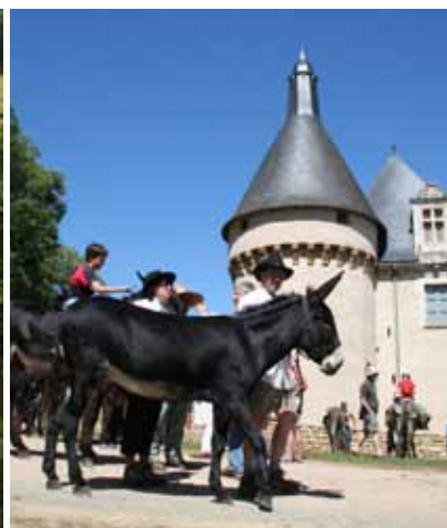
Château d'Ars