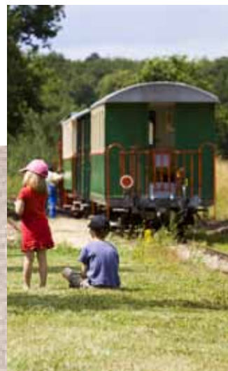
Train du Bas Berry

Les balades et randonnées du Train du Bas-Berry sont aussi une façon ludique de découvrir le territoire, à pied et en train touristique. Une invitation à musarder tout au long des 27 km de la voie métrique qui relie Ecueillé à Argy.