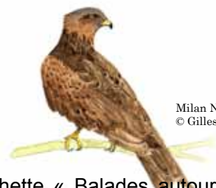
Milan Noir