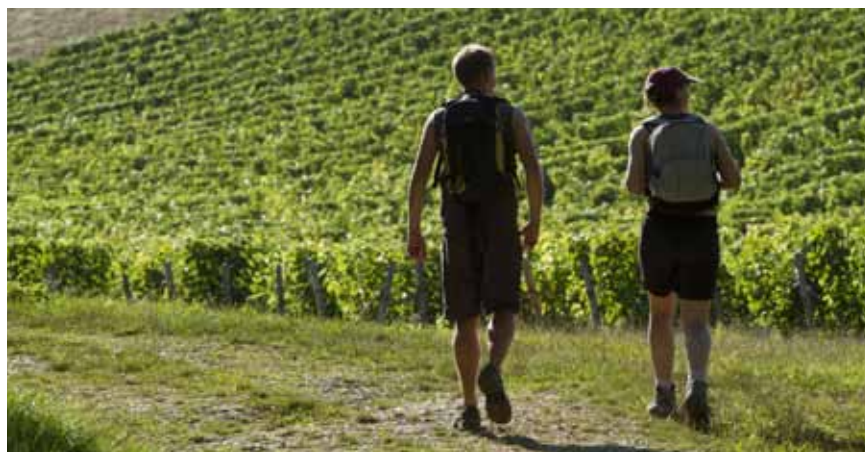
Dans les vignobles de Valençay