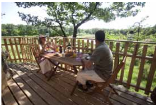
Cabanes de Chanteclair