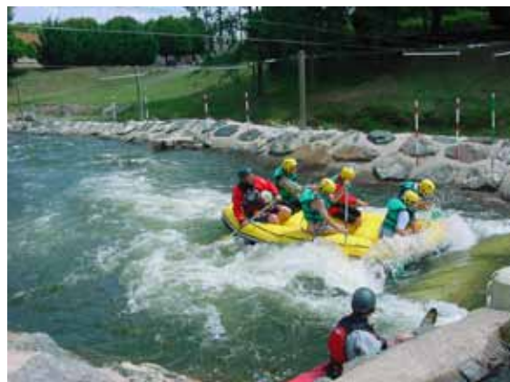
Stade d'eau vive de Tournon

Pour les novices, amateurs ou experts, le rendez-vous est donné au stade d'eau vive de Tournon-Saint-Martin pour une journée riche en sensations. Les animateurs sportifs du site proposent raft, nage en eaux vives, air boat ou entraînement sportif. http://stade.eau.vive.free.fr