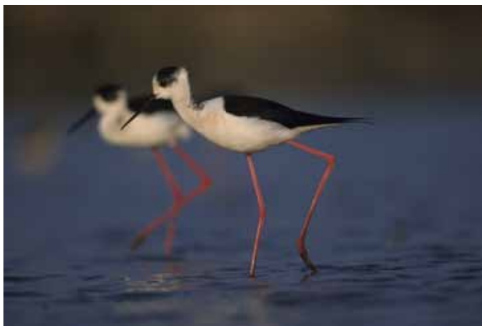
Echasses blanches

niveau international pour sa biodiversité. Une chambre d'hôtes de charme, située dans un parc clos labellisé refuge LPO jardin d'oiseaux, vous accueillera le premier soir autour d'une table d'hôtes de qualité. Le deuxième soir, vous dormirez dans un village vacances au bord d'un des plus beaux étangs de Brenne. Des paniers pique-nique de produits du terroir permettront de vous ravitailler avant de reprendre la route. D'autres circuits en itinérance de 3 à 5 jours verront le jour en 2012. Amoureux de la nature, vous apprécierez la variété des milieux naturels du Pays des Mille étangs : la Petite Brenne, la vallée escarpée de l'Anglin et les bocages du Boischaud Sud.