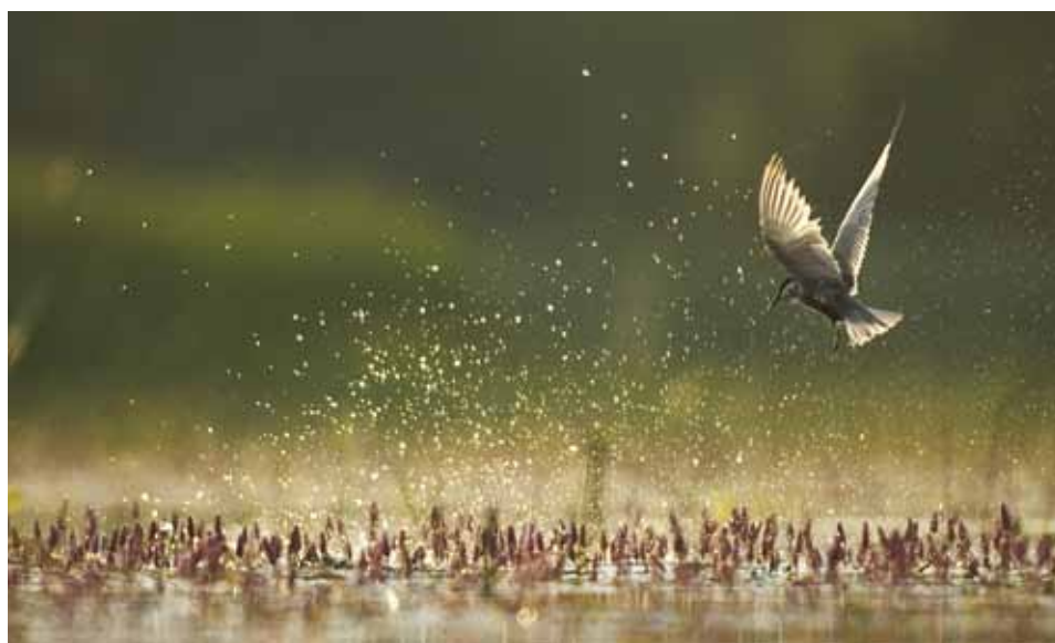
Guifette Moustac