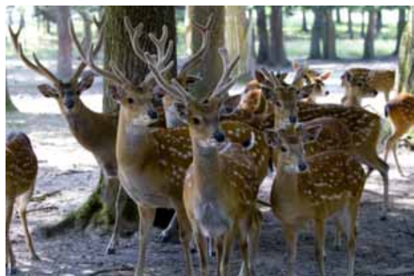
Réserve de la Haute-Touche

Avec plus de 1000 animaux, dont la plus importante collection de cervidés en Europe, la Réserve de la Haute-Touche est le plus vaste parc animalier de France. D'abord refuge et centre de reproduction, la réserve abrite aujourd'hui des espèces menacées et joue un rôle international dans les programmes de sauvegarde. L'accès à la réserve, en voiture, permet de découvrir les espèces rares, puis c'est à pied ou à vélo, dans les allées du parc que se poursuit la visite. La réserve propose des visites guidées pour adultes et pour enfants, des balades à vélo ou en calèche et des animations autour de la sauvegarde des espèces protégées. haute-touche.mnhn.fr